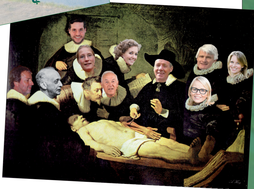
Met fotomanipulatie van Ab Kooy