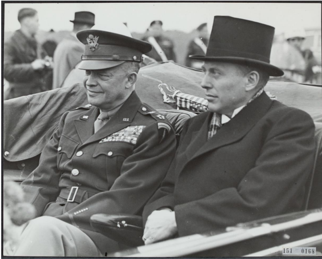
Minister-president Schermerhorn ontvangt generaal Dwight D. Eisenhower, 6 oktober 1945.